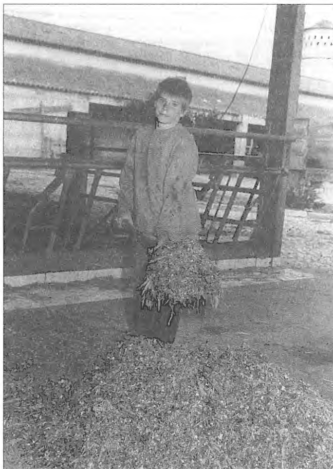
Assim se curam os males psicológicos e se faz a «reinsersão» social nas Casas do Gaiato.