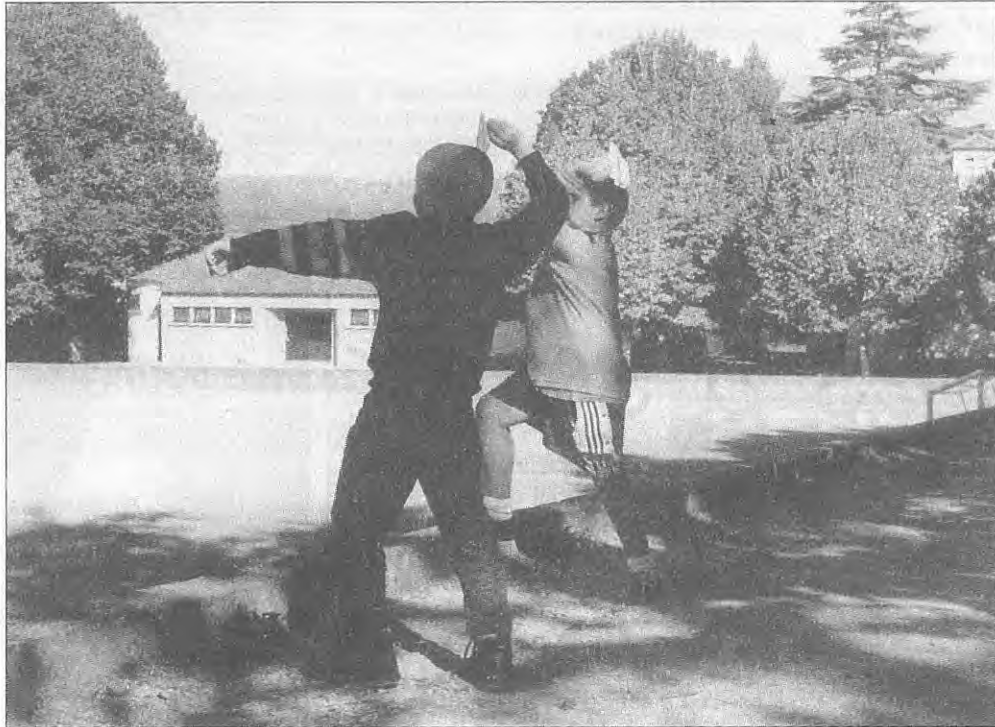
Paço de Sousa — Os «aviões» de papel enchem o coração dos mais pequenos, os «Batatinhas».