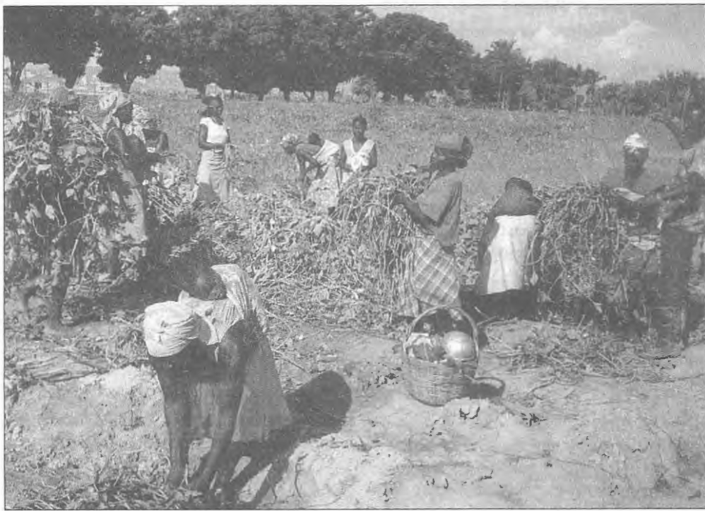
Uma colheita nos campos de Benguela